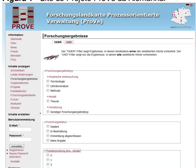
Figura 1 - Site do Projeto ProVe da Alemanha.

O processo de tradução do site, envolveu várias etapas, conteúdo, links, figuras. A figura 2 mostra como foi realizada a tradução das mesmas, tendo como o objetivo final criar o sistema do projeto com tradução para Português, Alemão e Inglês.